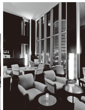
▲レストランロビー