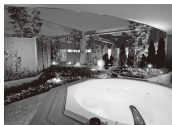
▲屋外ジャグジー(女性用)